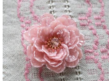
フラワーブローチ