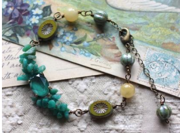
スワロフスキー×アマゾナイトブレス

講座開講店舗では、入会前に作品作りをお試しいただける体験レッスンを開催します。体験アクセサリー作品はブレスレットとブローチの2種類をご用意しています。どちらの作品も1時間～1時間半で完成させることができますので、お気軽にご参加ください。