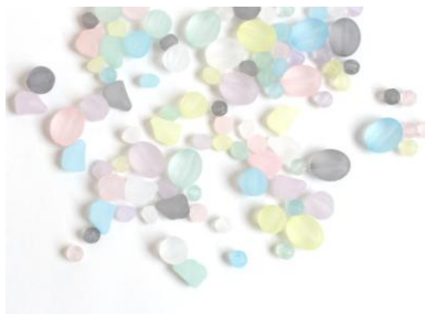
アクリル/全 35 種類 (5 タイプ各 7 色) 本体価格 200~280 円