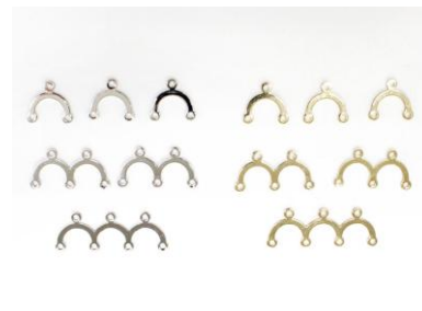
真鍮/全 6 種類 本体価格 250~280 円