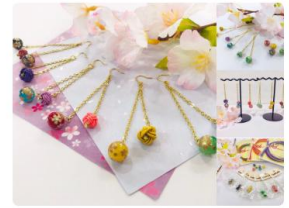
公式 Twitter アカウント投稿イメージ