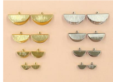
鉄・真鍮/2 ヶ入/全 8 種類 本体価格 280~320 円