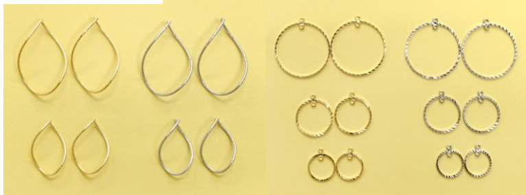
真鍮/2 ヶ入/全 10 種類 本体価格 250~300 円