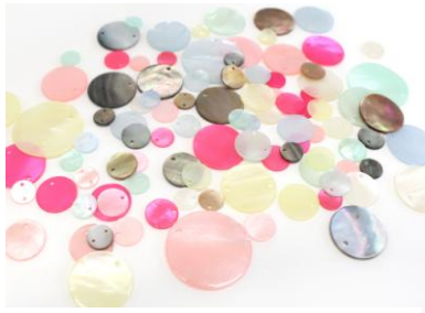
貝/全 56 種類 本体価格 180~260 円