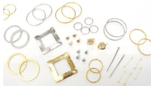
真鍮・ステンレス・鉄・アクリル/全 58 種類 本体価格 220~400 円

定番のメタルパーツは、人気のフープタイプから、大振りのチャームまで種類豊富にご用意しました。なかでも、極細9ピンは、ありそうでなかった細さを実現。シェルパーツ・シーグラスなど、どんな素材のパーツともマッチする万能パーツです。