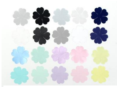
ポリエステル/4 枚入/全 20 種類 本体価格 300 円