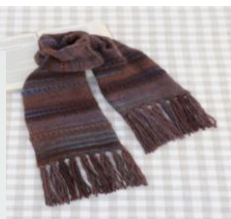
【ウイスター ジョット】 40g ¥714