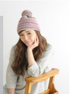
【ウイスター デルフィオーレ】 40g ¥714