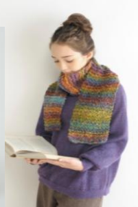
【ウイスター ヴェッキオ】 40g ¥714