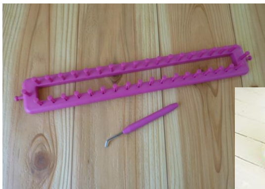
あめるモン2 1,365 円(税込) フック針付

新しくなったあめるモンを使って、簡単・手軽に自分だけのオリジナルニット作品作りを体験してみてください。