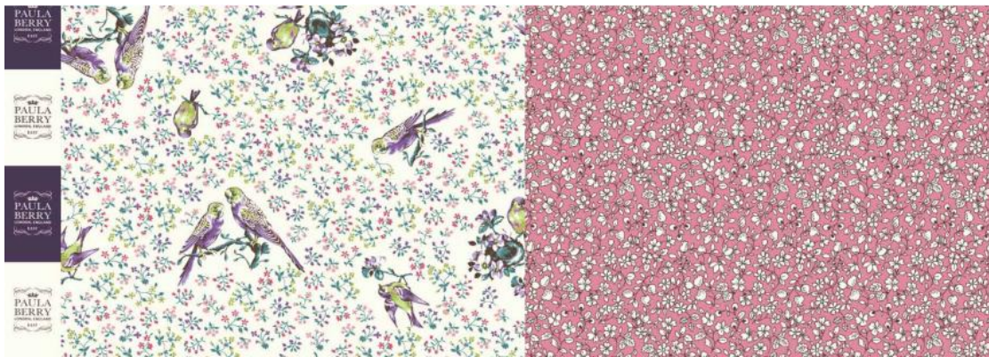
【Paradise Park(パラダイスパーク)】綿 100%、約 108cm 巾、全 1 種類(2 配色)、各 1,512 円(税込) / m

南国の島やリゾートを連想させるインコのイメージから、ネーミングをロンドンの公園「パラダイスパーク」とした2面構成のデザイン生地です。6面構成では難しい大きなサイズのアイテムも作ることができます。左端のブランドロゴは、作ったアイテムにタグとして使用するとオシャレ感がさらにアップします。45cm 角(標準サイズ)のクッションやカフェエプロン、ミトン、ランチョンマットなどキッチン小物にもおすすめです。6面構成の生地と組み合わせて使用することでよりバリエーションが広がりおしゃれな小物を作ることができます。