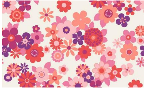
【Carnaby(カーナビー)】 綿 80% 麻 20%、約 106cm 巾、全 1 種類 (2 配色)、 各 1,620 円 (税込) / m

「スプリングフィールド」とはロンドンの公園の名前で、ナチュラルなボタニカル調の中花が春の庭を思わせるデザインです。「カーナビー」は楽しい 60 年代ヴィンテージポップな花柄で、60 年代を象徴するロンドンのカーナビーストリートからネーミングしました。ホルターネックのエプロンやサロンエプロン、テーブルクロス、バッグなどにおすすめの総柄のデザインです。