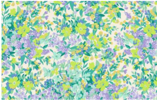
【Springfield(スプリングフィールド)】 綿 100%、約 108cm 巾、全 1 種類 (2 配色)、 各 1,404 円 (税込) / m