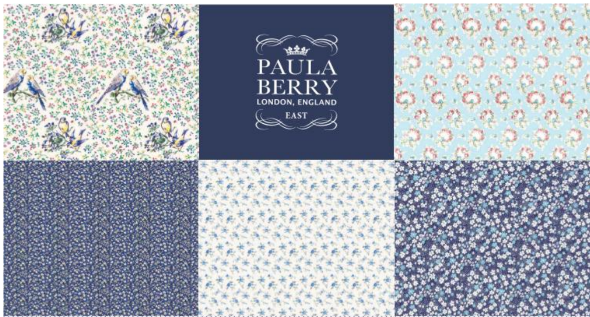
【Brick Lane(ブリックレーン)】綿 100%、約 108cm 巾×58cm パネル、全 1 種類(2 配色)、1,080 円(税込)／枚

この度、藤久では「PAULA BERRY」プロデュースのもと 60～70 年代頃の欧州ヴィンテージ生地をアイデアソースにデザインした大人可愛い花柄中心のテキスタイルを発売いたします。生地の活用法も考えてパターンが構成されているので、それぞれの特性を活かした様々なアイテムを作ることができます。ぜひこの機会にソーイング好きの方も、初心者の方もおしゃれな小物作りを始めてみてはいかがでしょうか？