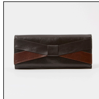
▲ジャンセン/長財布 販売価格: ¥20,520