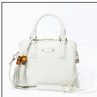
▲オストゥーニ/ポシェット 販売価格: ¥35,640