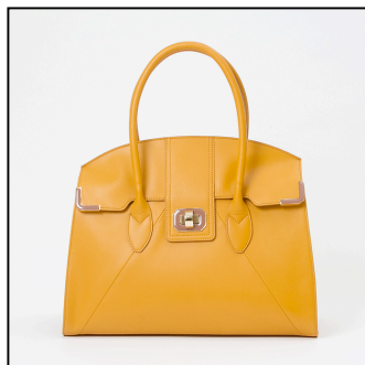
▲ラファエロ/トート 販売価格: ¥48,600 ※Ray11月号他二誌掲載商品