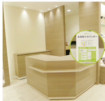
▲tab モールサービスカウンター