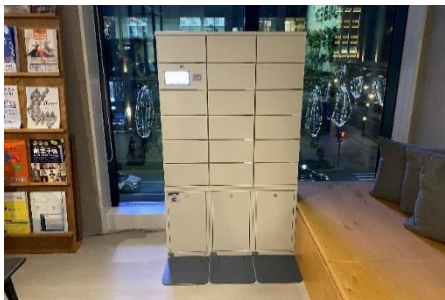
象印マイボトルクローク