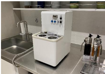
象印マイボトル洗浄機

住所：東京都中央区日本橋 1 丁目 1 3-1（日鉄日本橋ビル 1 階、3 階）