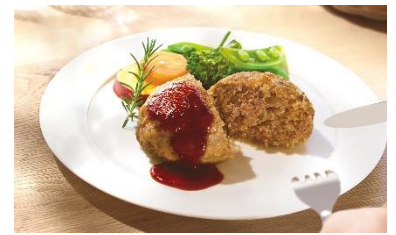
ハンバーグも約8分 ※4 で調理することができます