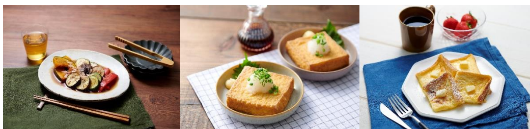
左から 野菜の焼きびたし、厚揚げのカリカリ焼き、フレンチトースト