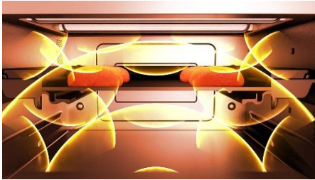
レンジで素早く芯まであたため

レンジ機能で食材の中まで素早く加熱し、その後は自動でグリル機能に切り換えるので本格的な料理も短時間でおいしく作ることができます。角皿はマイクロ波を透過する陶磁器（セラミック）製なので、レジグリ機能を最大限に活かします。グリル加熱からレンジ加熱の自動切り換えも、手動で設定できます。