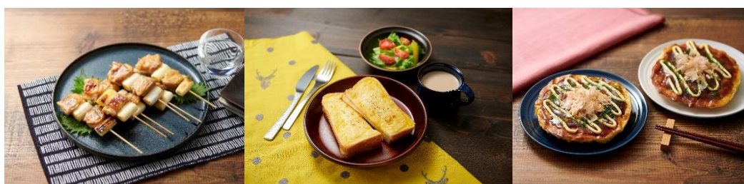
左から 焼き鳥、コーンポタージュクロックムッシュ、お好み焼き