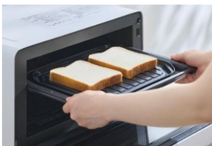
食パンを庫内に入れて