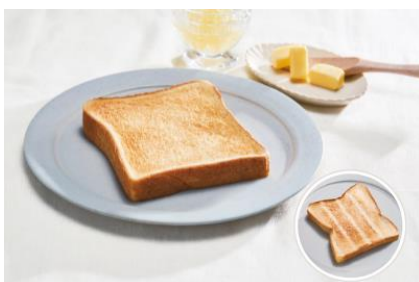
焼き上がりのトースト (画像右下がトーストの裏面)