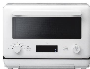
オーブンレンジ「EVERINO」ES-KA18 パールホワイト（-WM）