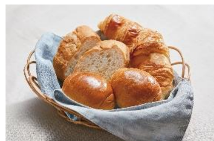
リベイクもできます