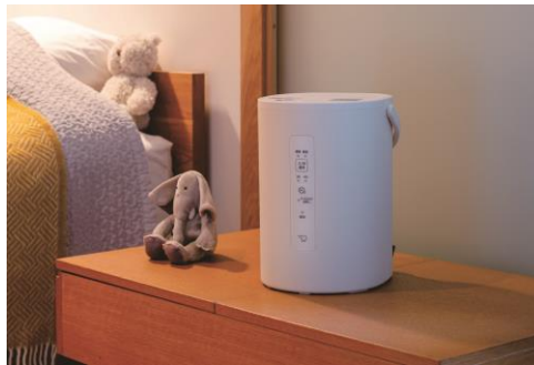
スチーム式加湿器(EE-MA20)

適用床面積：木造和室～3畳(6㎡) / プレハブ洋室～6畳(9㎡) 加湿能力：200mL/h