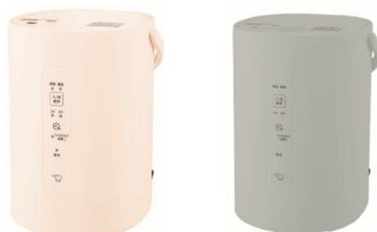
スチーム式加湿器 EE-MA20 オフホワイト (-WA)、グリーン (-GA)