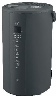
スチーム式加湿器 (EE-TA60)