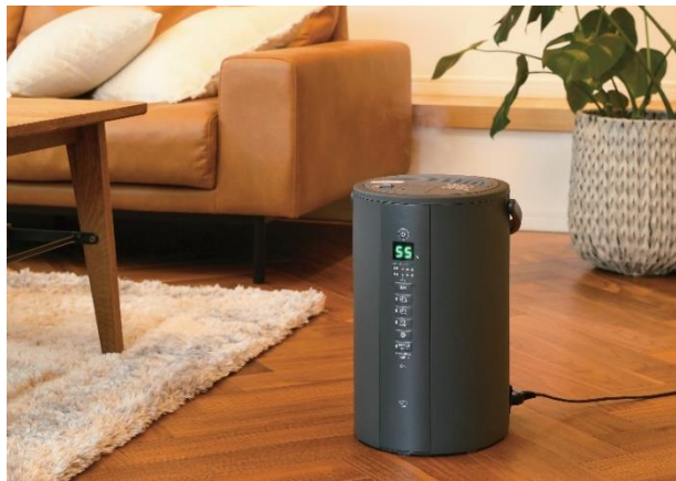
スチーム式加湿器(EE-TA60)

適用床面積：木造和室～10 畳(17m 2 )/プレハブ洋室～17 畳(27 m 2 ) 加湿能力：600mL/h