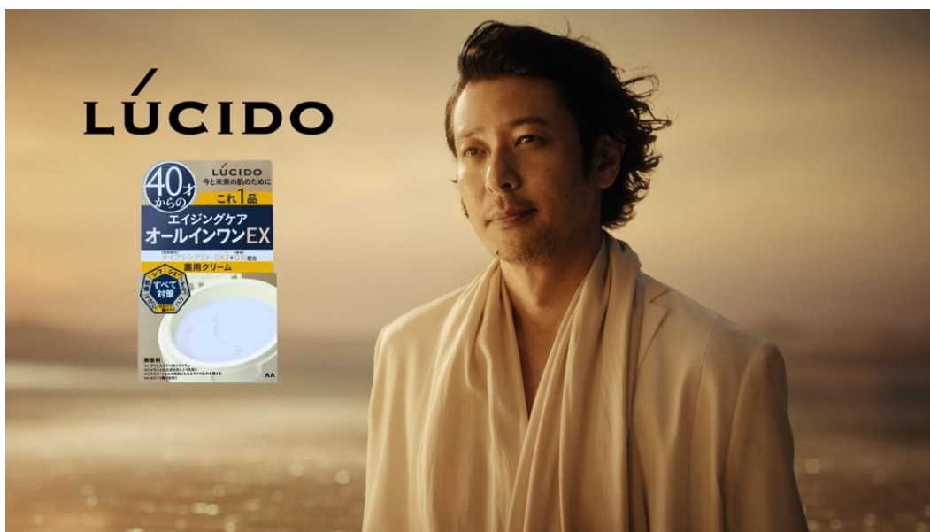
「ルシード 薬用パーフェクトスキンクリーム EX」新CM

株式会社マンダム(本社:大阪市 社長執行役員:西村健)は、ミドル男性向け化粧品ブランド「ルシード」で、アンバサダーである俳優のオダギリジョーさんを起用した「ルシード 薬用パーフェクトスキンクリーム EX」の新CMを2025年10月1日(水)より公開します。