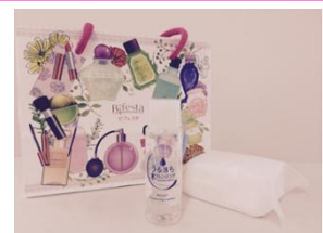
うる落ち水クレンジング