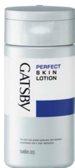
ギャツビー パーフェクトスキンローション 150ml／¥900(税抜)