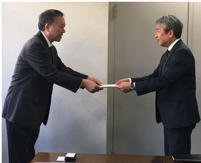
特例子会社認定書授与式

マンダムグループは多様性を受け入れ、個々の能力を最大限発揮し、企業と社員が共に成長できるように、「ダイバーシティ&インクルージョン」を推進しています。今後も、全社員が「人財」となり、働きがいを得て活躍できる会社の実現に向けて人財育成や環境・制度の整備に取り組んでいきます。