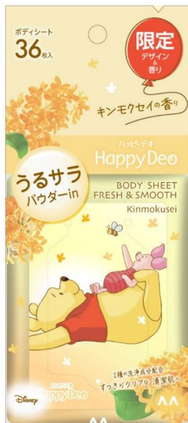
© DISNEY Based on the "Winnie the Pooh" works by A.A. Milne and E.H. Shepard.

株式会社マンダム(本社:大阪市 社長執行役員:西村健)は、使うときや持ち歩くときにもハッピーな気分になれるエチケットシリーズ「マンダム ハッピーデオ ボディシート」より、ディズニー限定デザインの「うるサラ キンモクセイ」と「極冷 スノーアップル」を2025年2月10日(月)より数量限定で発売します。