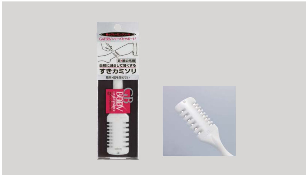
GB ボディ ヘアトリマー