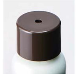
トリートメント容器