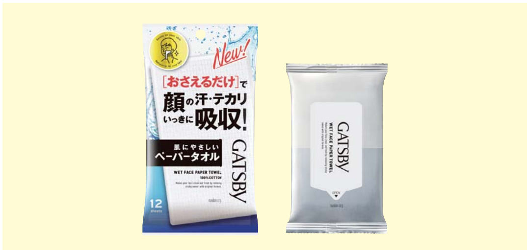
ギャツビー フェイスペーパータオル