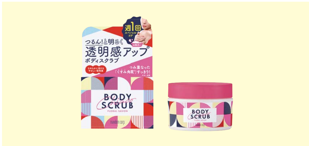
マンダム チアコ ボディスクラブ フローラルシャボン