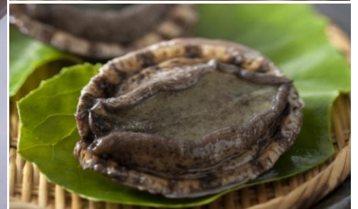
新メインダイニング 「ザ・ダイニングルーム」新メニュー イメージ