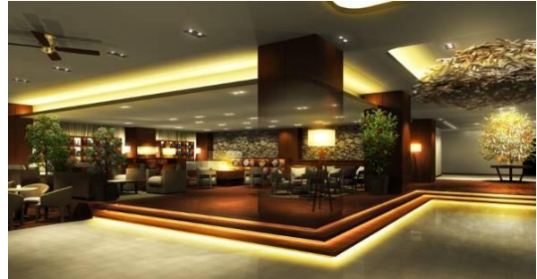
「ザ・ロビーラウンジ」 イメージ

三井不動産リゾートグループは、全国3カ所にてリゾート施設を展開しています（3施設458室）。今後も、豊かな自然と地域特性を活かした食・温泉・スパ・自然体験・ゴルフなどの多彩なサービスメニューやアクティビティ、温かいおもてなしにより、魅力あふれる滞在空間の提供に努めてまいります。