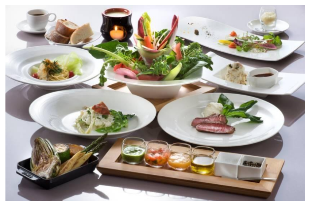
新メインダイニング「ザ・ダイニングルーム」新メニュー イメージ