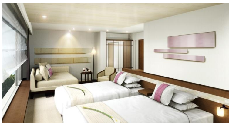
新客室「プレミアデラックスルーム」イメージ