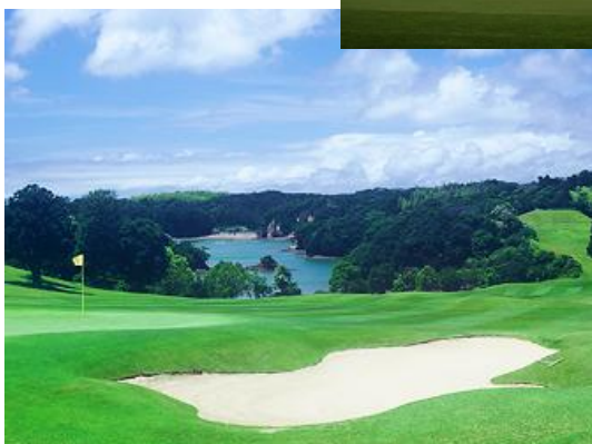
合歓の郷ゴルフクラブ (LPGA 認定)