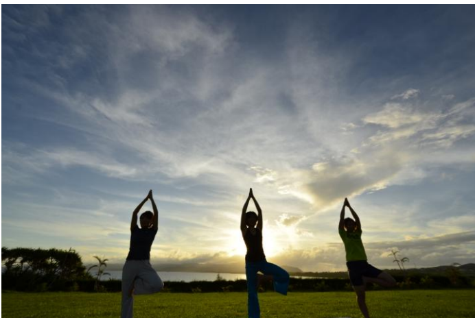
“伊勢志摩リゾートセラピー” イメージ

※「里海」とは、漁業や日々の生活を通じて人と海が関わりながら豊かな自然環境が保たれている沿岸域のことを指します。