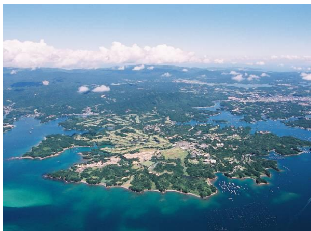
合歓の郷ホテル&リゾート 全景