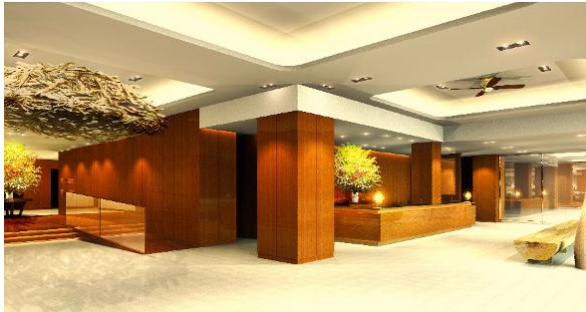
エントランス イメージ

「自然の中のリゾート」をテーマに、ナチュラルで暖かみがある上質な空間に生まれ変わります。「ザ・ロビーラウンジ」ではオープンエアテラスとゆらめく炎が印象的な暖炉が設置された心地よい空間でワインなどのお飲物をお楽しみいただける他、ライブラリーの本を片手にご自由にお過ごしいただけます。