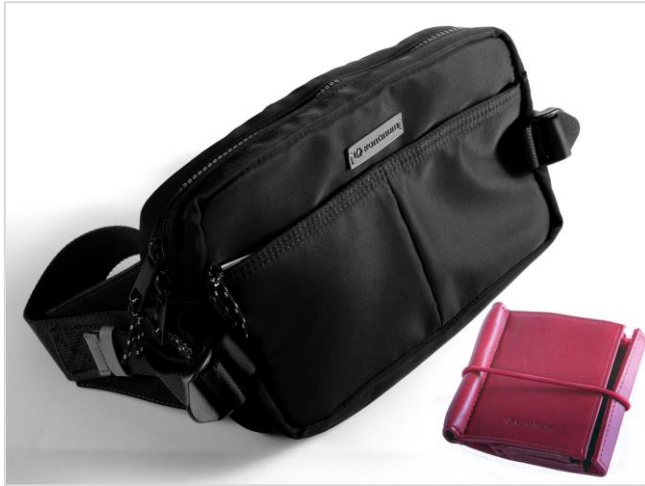
[ウェストバッグ、革製スタンド(マイクロ SD カードホルダー付き)、本体用ポーチが付属]