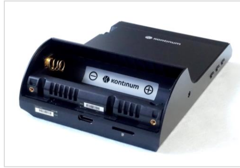
[独立したバッテリーハウス]