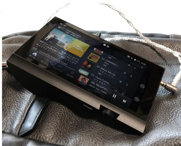
[アプリ表示画面例(横向き UI 対応)]

※システムはカスタマイズ仕様のため、Google Play ストアには対応しておりません。 また、すべてのアプリの動作やサービスを保証するものではありません。XAPK 形式には現時点では対応しておりません。