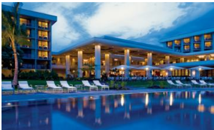
ワイコロア・ビーチ・マリオット・リゾート&スパ

オアフ島をはじめ、8つの主要な島と小さな島々からなるハワイ諸島。温かなアロハスピリッツが訪れる者を魅了し続けています。中でもハワイ島は、美しい海に豊かな自然、キラウエア火山、そしてローカルフードなど、たくさんの魅力があふれる島。本フェアではそんなハワイ島にある「ワイコロア・ビーチ・マリオット・リゾート&スパ」との共催で実現します。同じように緑に囲まれ、都心ながらも隠れ家のような魅力がある東京マリオットホテルが、まるでハワイ島に旅したかのようなひとときを提供。洗練されたスタイルと安らぎの時間に包まれたリゾートエクスペリエンスを再現します。