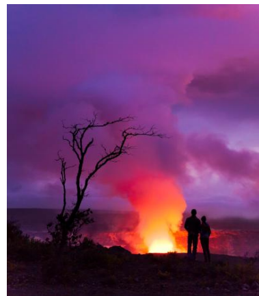
ハワイ島 キラウエア火山