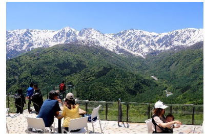
白馬岩岳マウンテンリゾート（提供）

ゴンドラリフト「ノア」での空中散歩の先に広がる白馬岩岳マウンテンリゾートは、標高 1,289m から白馬三山を（白馬岳、杓子岳、白馬鑓ヶ岳）を正面に見据える絶景空間です。北アルプスを一望できるテラス&カフェ「HAKUBA MOUNTAIN HARBOR」をはじめ、アニメの主人公になった気分が味わえると話題の大型ブランコ「ヤッホー！スウィング presented by にゃんこ大戦争（ガイド付き）」、愛犬と同乗できる山頂エリア周遊「バギークルーズ」など子供から大人まで楽しめる様々なアクティビティや、ペット連れにも嬉しい専用施設が揃います。