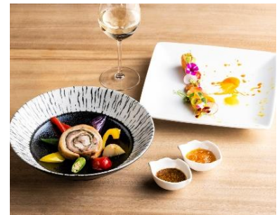
Shinshu Blessings Dinner -Summer- LAVAROCK イメージ