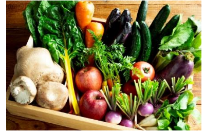
夏野菜のお土産セット イメージ

全7品：カラフルなニンジン・ナス・じゃがいも・オクラ・ズッキーニなど、その日に採れた野菜全7品