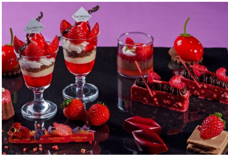
「Strawberry Red Afternoon Tea」イメージ