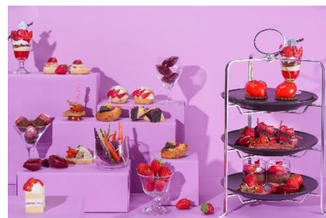
「Strawberry Red Afternoon Tea Weekend」イメージ

オリジナルモクテル ※ / JING TEA / Ronnefeldt ティーセレクション / コーヒー など 19 種