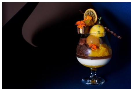
「シーズナルパフェ ～シトラス ブリーズ～」イメージ

季節のフルーツや食材が持つ美味しさを最大限に引き出した、パティシエのイマジネーション光るシーズナルパフェ。愛媛県産のみかんを主役に、1月は糖度の高い「紅まどんな」を、2月はプレミアムな「甘平」をチョイスし、フレッシュなみかんの果肉に加え、皮を煮詰めてジュレやソースにし余すところなくお楽しみいただけます。また、みかんを引き立てるチョコレートのムースやクリーム、クラシックショコラなど、パティシエの「好き」を重ねたパフェを、ウイスキーなどのお酒とともにお召し上がりください。