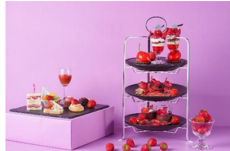
「Strawberry Red Afternoon Tea Weekday」イメージ

JING TEA / Ronnefeldt ティーセレクション / オリジナルコーヒー など 16 種