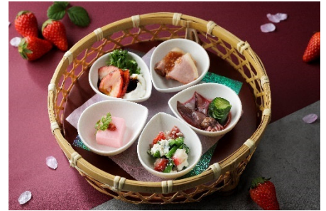
季節の前菜 イメージ