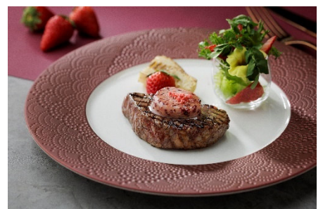
お肉料理 イメージ