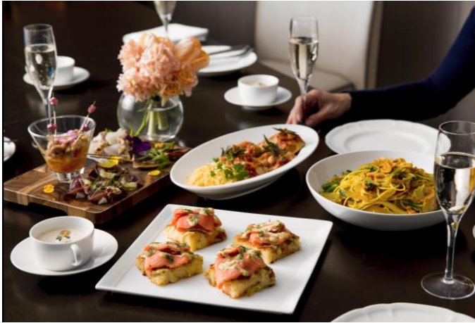
ギャザリングコース イメージ