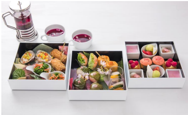
SAKURA テラスボックス(写真は2名様分です)

期 間：2017 年 3 月 1 日（水）～4 月中旬 時 間：12:00～16:00（L.O.） 料 金：1 名様 ¥4,000（2 名様より）