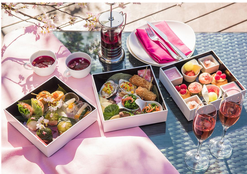
春の SAKURA テラスボックス

東京マリオットホテル(東京都品川区 総支配人:飯田雄介)では、2017年3月1日(水)より、ラウンジ&ダイニングGにて『Gotenyama Sakura Gatherings』をテーマに春のメニューをご提供いたします。江戸時代から桜の名所として親しまれてきた御殿山に佇む当ホテルは、春になるとホテルに隣接する庭園が桜色に染まり、美しい景色をお楽しみいただけます。この庭園を望む「SAKURA テラス」でお届けするテラスボックスや、春の門出の集いにふさわしい華やかなギャザリングプランなど、麗らかな春にシェアしてお楽しみいただく至極のメニューをお届けします。