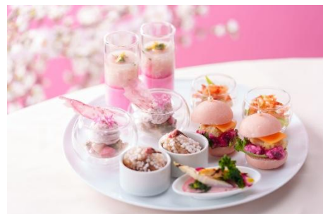
セイボリー イメージ