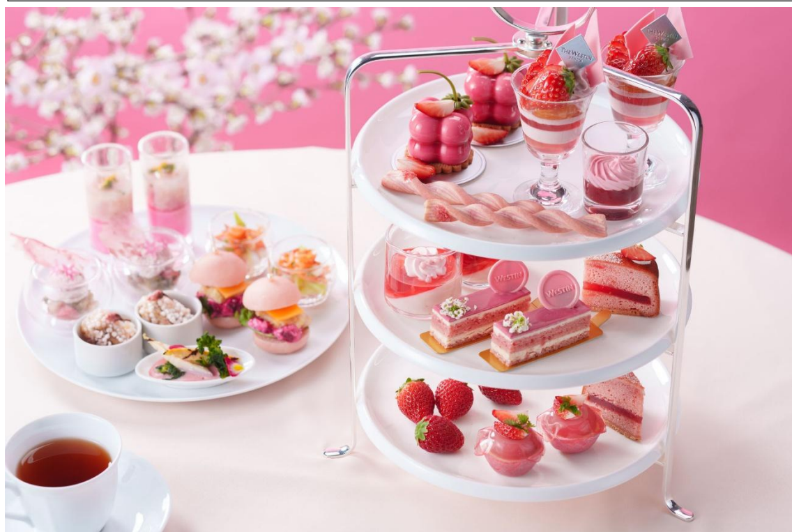
「Afternoon Tea -Pink Strawberry-」イメージ

ウェスティンホテル仙台(仙台市青葉区一番町、総支配人 下重 和之)では、2026 年 3 月 14 日(土)～5 月 15 日(金)の期間、春の訪れを感じるピンクを基調にした「Afternoon Tea -Pink Strawberry-」を発売します。