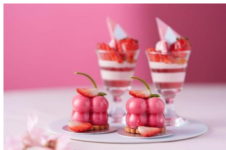
スイーツ イメージ

※掲載の料金はサービス料・消費税込みの料金です。 ※記載の営業時間およびメニュー内容は変更になる場合がございます。