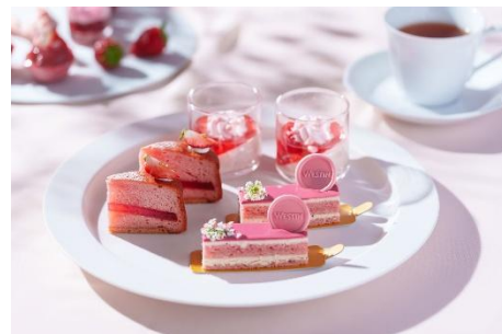
スイーツ イメージ