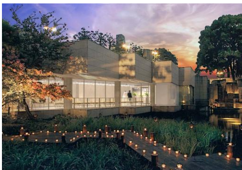
※「ザ・フォレストチャペル」外観イメージ

御殿山庭園の中に佇む、優美で贅沢な独立型チャペルが2014年2月下旬、新たに誕生いたします。御殿山の自然と調和し、やわらかい光が降り注ぐチャペル内には、上品にクリスタルが散りばめられ、約130㎡の広さに80席が設けられます。