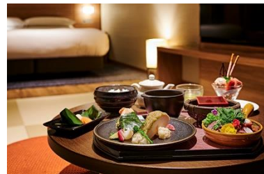
インルームディナーイメージ

食膳スタイルでお部屋にお届ける本プラン限定ディナーは、高たんぱくで低カロリーな馬肉を使った生ハムや春キャベツや信州ベーコンを使ったサフラン風味のスープのほか、栄養成分が豊富なクレソンと信州福味鶏と一緒に香ばしく焼き上げた一品など、美容と健康を意識した特別メニューをご用意。周りや時間を気にすることなく、くつろぎのディナータイムをお過ごしいただけます。