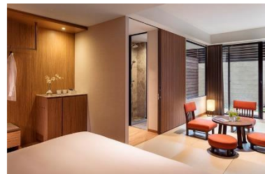
温泉露天風呂付プレミアムルーム