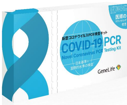
PCR 検査キット イメージ