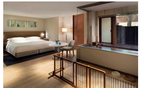
温泉付デラックスコテージキング