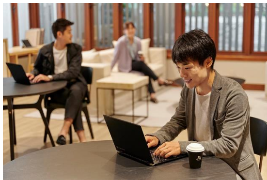
軽井沢マリオットホテル Work Lounge イメージ