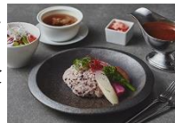
近江牛の薬膳キーマカレー

ホテルに連泊する際にも気軽にお召し上がりいただける、「ウェルネス」をテーマに地域の旬の食材を使った特別メニューをご用意しています。