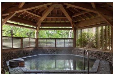
富士マリオットホテル山中湖 温泉露天風呂