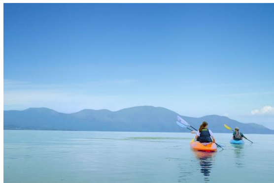
琵琶湖マリオットホテル カヤック体験イメージ

森トラスト・ホテルズ&リゾート株式会社（本社：東京都品川区、代表取締役社長：伊達美和子）では、当社運営のリゾートホテル6施設にて、ニューノーマル時代の新しい働き方として注目されているワーケーションを2泊3日で体験していただくモニターを募集いたします。