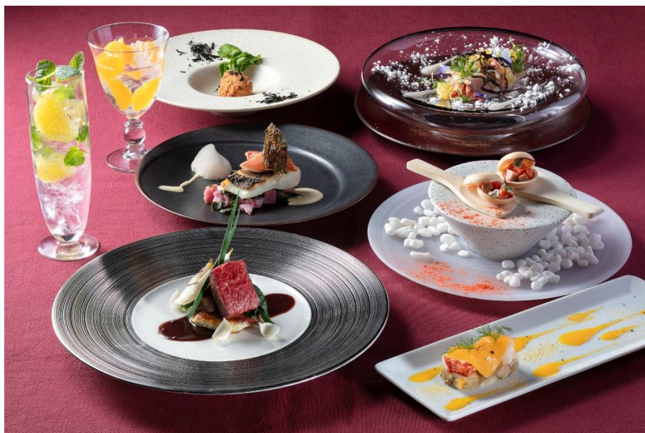
SENDAI meets HIROSHIMA イメージ