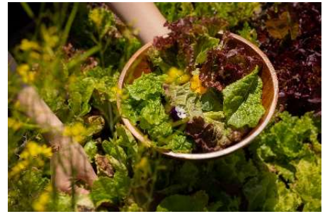
摘み取り野菜 イメージ