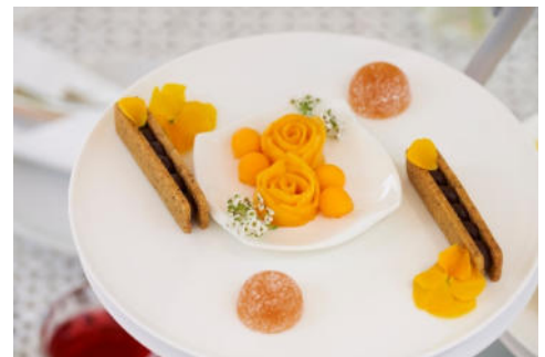
スイーツ イメージ