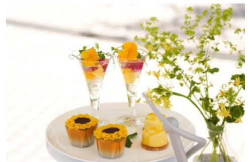
スイーツ イメージ