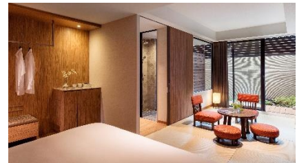
温泉露天風呂付プレミアルーム イメージ

※上記はサービス料・消費税込の料金です。別途、入湯税を申し受けます。 ※料金はご宿泊日により異なります。詳しくはお問合せください。 ※提供のメニュー内容は変更となる可能性がございます。 ※ご夕食付きのプランもご用意しております。詳しくはお問合せください。