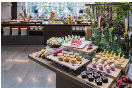
ウィークエンドランチbuffet (イメージ)

開放感あふれるアトリウムにて厳選したハワイ食材やトロピカルフルーツをふんだんに使用したメニューでお届けします。ワイコロアビーチ マリオット リゾート&スパ シェフ監修のメニューやカラフルな前菜、フォトジェニックなスイーツに至るまで、ハワイへショートトリップしたかのようなリゾート気分の一ときをお楽しみください。