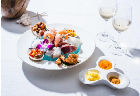
シーフードプラッター

東京マリオットホテルのシグネチャーディナーがハワイアンスタイルで登場。トロピカルオーシャンをイメージしたシーフードプラッターの前菜や、提供時にサプライズ感のあるダイナミックなグリルの盛り合わせ（表紙画像左）を、本場さながらに皆さままでシェアしてお楽しみいただけます。