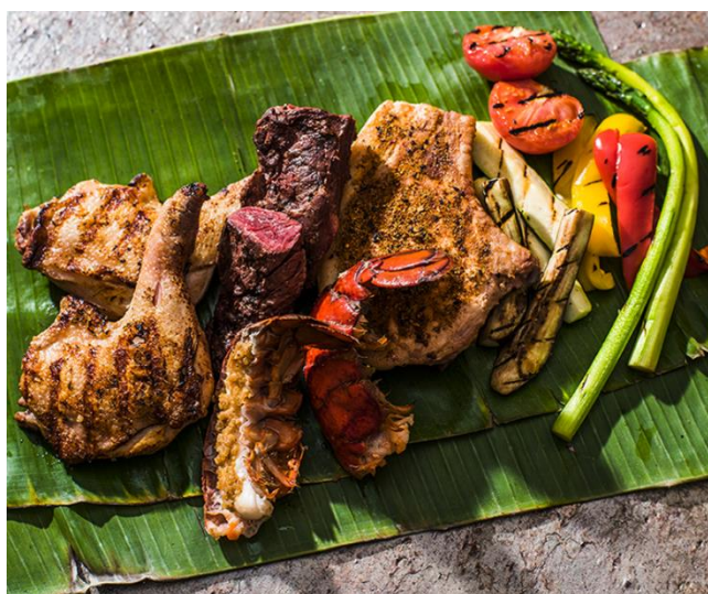
ハワイアン グリルコンボ ディナー（イメージ）

東京マリオットホテル（東京都品川区 総支配人：飯田雄介）では、2017年7月1日（土）～8月31日（木）まで、昨年のご好評にお応えしハワイの中で最も雄大な自然を誇る「ハワイ島」をフィーチャーした『Aloha Hawaii Experience』を開催いたします。期間中は、2017年7月にリニューアルオープンをするハワイ島のワイコロア ビーチ マリオットリゾート&スパ シェフ監修buffetや、ハワイの新しいローカルトレンドを取り入れたダイナミックなディナーコース、ハワイの息吹を感じていただけるイベントなど多と彩に展開。都会の喧騒から離れて、ハワイ島にショートトリップしたかのような体験をお楽しみください。