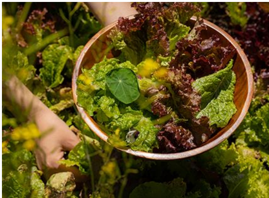
摘みたて野菜 イメージ