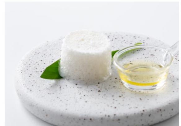
「雲に見立てた宮古島産トマトのムース」イメージ