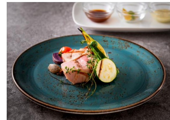
「アグー豚」イメージ