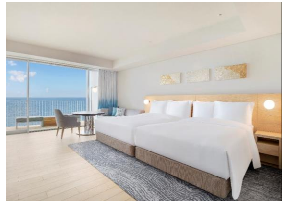
「アッパーオーシャンビュールーム」イメージ