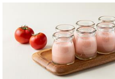
オリジナルスムージー イメージ