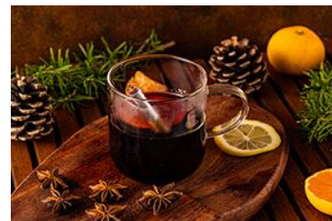
フルーティーホットワインイメージ