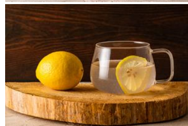
レモネード ICE イメージ(上) レモネード HOT イメージ(下)