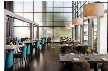
レストランイメージ