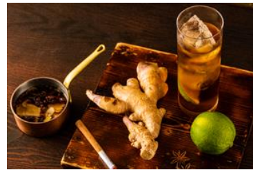
SHUZENJI モスコミュールイメージ