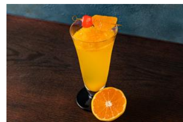
IZU みかんミモザイメージ