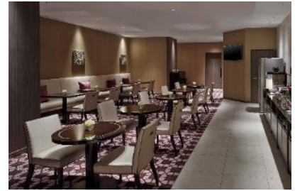
エグゼクティブラウンジ（イメージ）

ご自宅の近場で、日常から離れてゆったりと過ごす“ステイケーション”。東京マリオットホテルでは贅沢な“ステイケーション”を手軽にお楽しみいただけるよう、東京都にお住まいの方限定でエグゼクティブフロアでのご宿泊を通常よりも30%お得にご利用できる宿泊プランを提供いたします。21階以上のエグゼクティブフロアの客室から望む開放感あふれる景色に、エグゼクティブラウンジでの快適なひとときなど、ワンランク上のご滞在をリーズナブルにお楽しみいただけます。また、お車でもお越しいただけるよう駐車場のご利用はご滞在中無料。緑豊かな御殿山で、心と身体をリフレッシュする贅沢なひとときをご堪能ください。