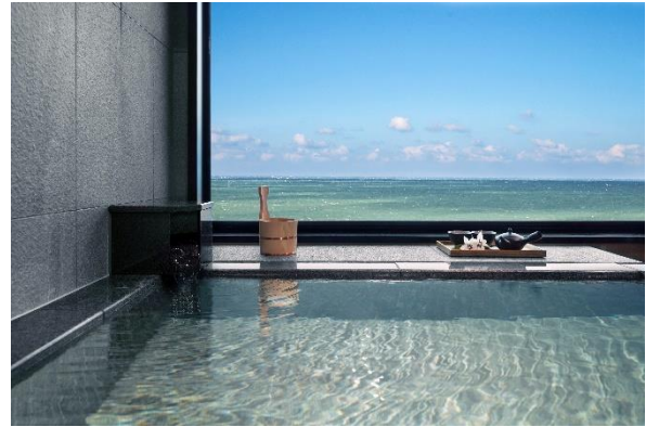
南紀白浜マリオットホテル 温泉ビューバス付プレミアムルーム

日本の5つのリゾートに位置する伊豆マリオットホテル修善寺、富士マリオットホテル山中湖、軽井沢マリオットホテル、琵琶湖マリオットホテル、南紀白浜マリオットホテルでは、地域の持つ魅力と施設の特長を活かして様々なウェルネス・エクスペリエンスを提供する「Wellness Go キャンペーン」の一環として、2020年9月より秋の宿泊プランやアクティビティプログラムを展開してまいります。