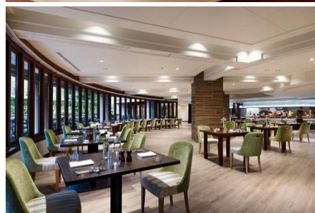
（写真上）ポワソンイメージ