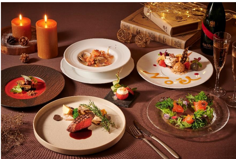
クリスマスディナーイメージ