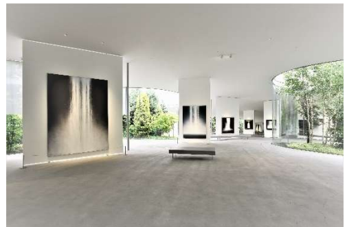
軽井沢千住博美術館

※上記料金はサービス料・消費税込みの料金です。別途、入湯税を申し受けます。 ※料金はお部屋タイプ・ご利用日により異なります。詳しくはお問い合わせください。