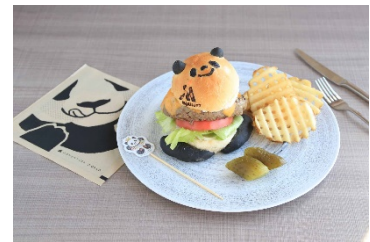
Marriott Panda Burger イメージ