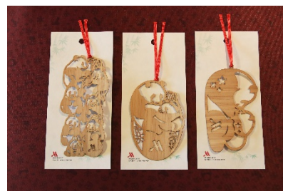
オリジナル竹ブックマーカーイメージ