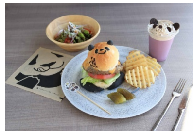
Marriott Panda Burger セット イメージ

マリriottホテルのシグネチャーフードであるマリriottバーガーのレシピをそのままに、アドベンチャーワールド監修のパンダバンズを使用したバーガー、季節のパンダスムージー、サラダのセットです。バンズの絵柄は楓浜の楽しそうな笑顔をデザインしています。開放的なホテルラウンジやお部屋で、ご家族やご友人と一緒にほのぼのとしたパンダの笑顔に癒されるひとときをお過ごしください。