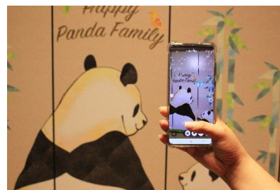
動くフォトフレームイメージ