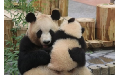
キャンペーン投稿写真 イメージ