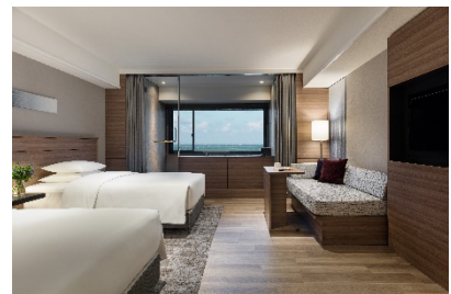
温泉付 プレミアールーム