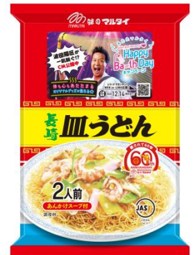
数量限定キャンペーンパッケージ

家庭用皿うどん売上NO.1の人気商品です。お好 みの具を炒め、そのまま添付のあんかけスープを 加えて煮込めば、とろーり白湯風味の「あんかけ 具」が完成。植物油脂100%で揚げた香ばしいパ リパリ麺にあんかけ具をかけるだけで、簡単に美 味しい皿うどんが召し上がれます！旬の野菜もた っぷり採れる逸品です。