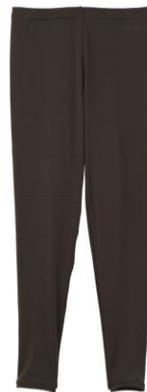
おうちインナー レギンス 9,900 円