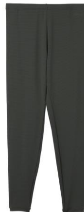
おうちインナー レギンス 9,900 円