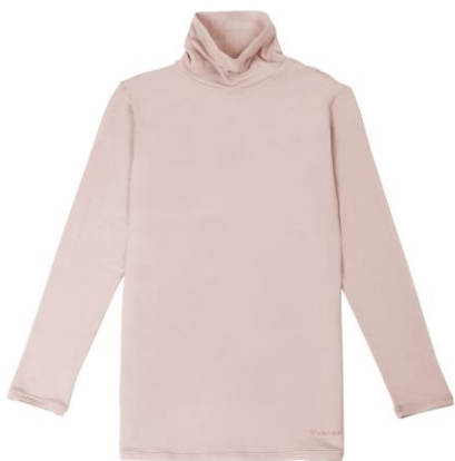
おうちインナー タートルネック 9分袖 11,000 円