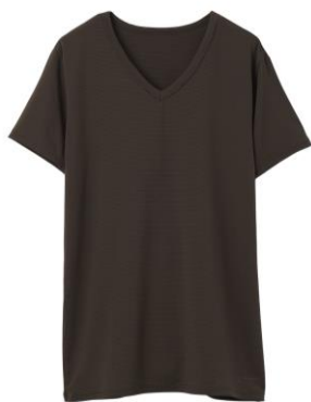
おうちインナー Vネック半袖 8,800 円