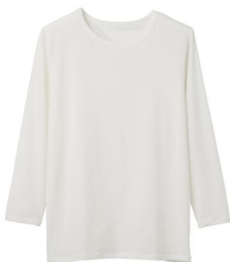
おうちインナー クルーネック 9分袖 9,900 円