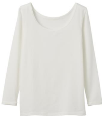
おうちインナー Uネック 9分袖 9,900 円